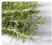
ローズマリー 葉エキス