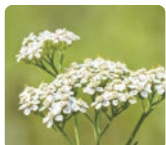
セイヨウ ノギリソウエキス