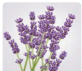
ラベンダー 花エキス