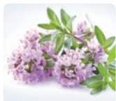
タチジャコソウ(タイム) 花/葉エキス