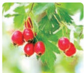
セイヨウサンザシ 果実エキス