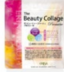
ザ・ビューティー コラージュ プルミエール