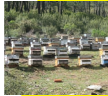
サラマンカの養蜂場

エリナのビー・ポランの故郷はスペイン西部に位置するサラマンカ。年間を通して比較的温暖なサラマンカは、いつもさまざまな種類の花が咲き誇っています。多彩な花々から蜜を集めるミツバチたちのビー・ポランは、色も栄養成分もバラエティに富んだマルチカラー。世界中のビー・ポランを分析し、たどり着いたスペイン・サラマンカ産。エリナならではのこだわりのビー・ポランです。