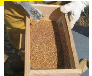
収穫したてのビー・ポラン