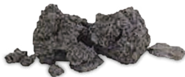
エヌシーエムの原料「腐植土頁岩」