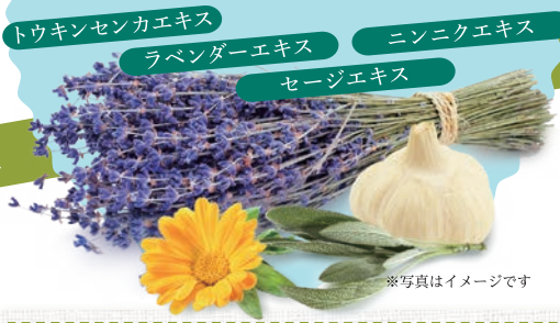
トウキンセンカエキス ラベンダーエキス ニンニクエキス セージエキス