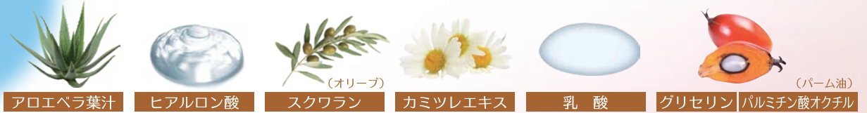
アロエベラ葉汁 ヒアルロン酸 スクワラン カミツレエキス 乳酸 グリセリン パルミチン酸オクチル

さらに 4種類のエイジングケア ※ 成分で 肌環境をサポート!! ※年相応の状態を保つこと