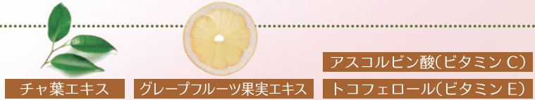
チャ葉エキス グレープフルーツ果実エキス アスコルビン酸(ビタミンC) トコフェロール(ビタミンE)

さらに 4種類のエイジングケア ※ 成分で 肌環境をサポート!! ※年相応の状態を保つこと