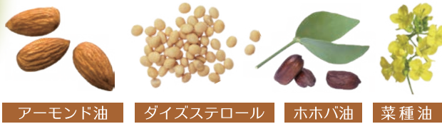
アーモンド油 ダイズステロール ホホバ油 菜種油

4つの植物オイルの力で、 角層細胞間脂質をサポート。 やわらかな肌へと導きます。