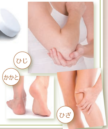
ひじ かかと ひざ